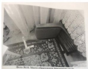
Фото М18. Макро снимок отпечатка пальца.