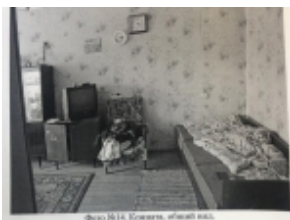
Фото М14. Комната, общий вид.